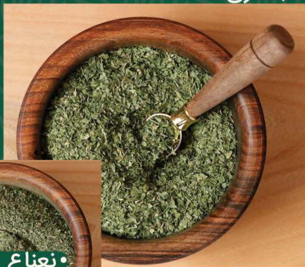
• نعناع خشک