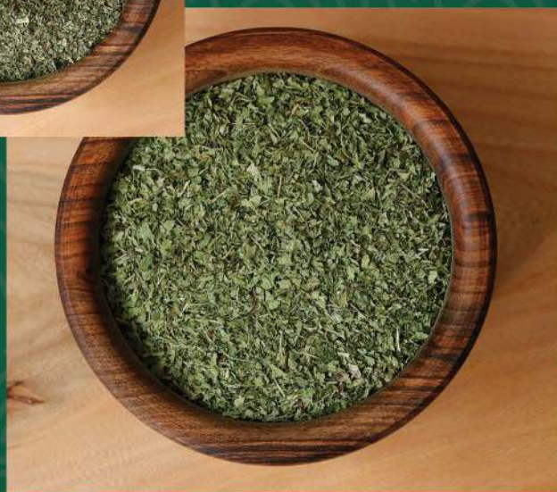
• گشنیز خشک