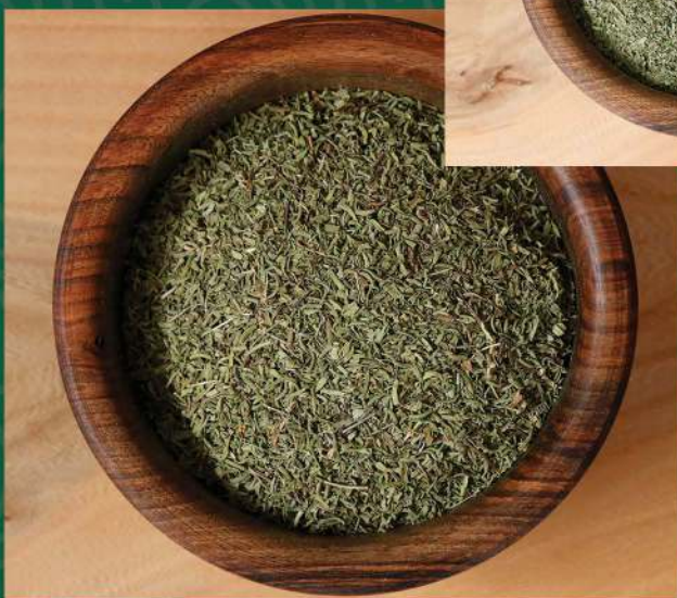
• مرزه خشک