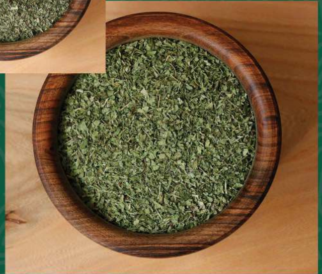
• الكزبرة الجافة