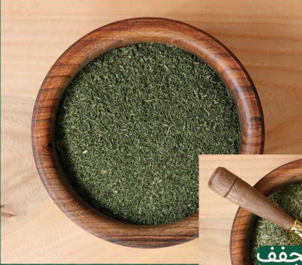
• الشبت الجاف