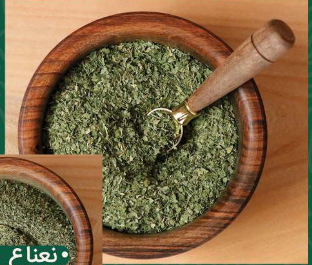
• نعناع مجفف