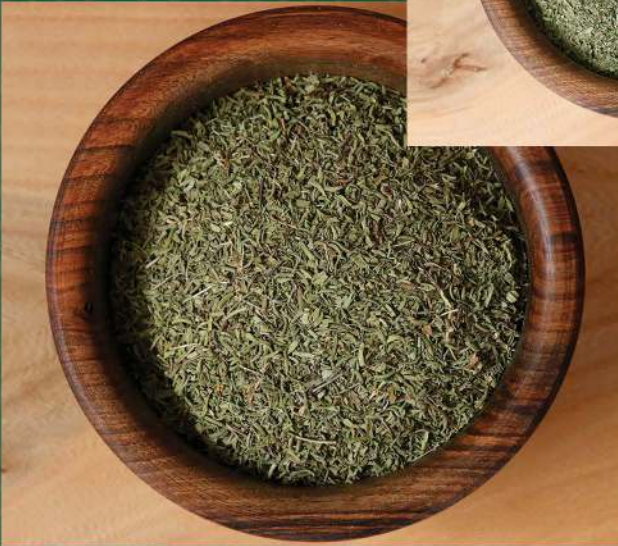
• ندغ مجفف